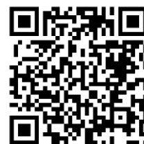
桃園市公立及非營利幼兒園 招生網